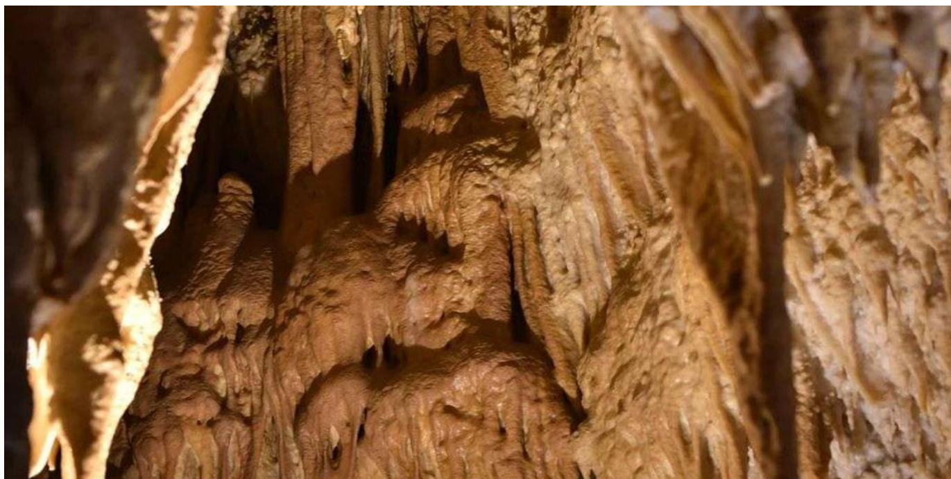
La grotte de Villars.